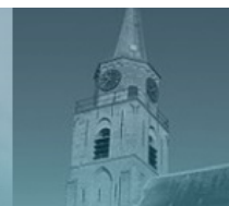
Oude Kerk Scheveningen